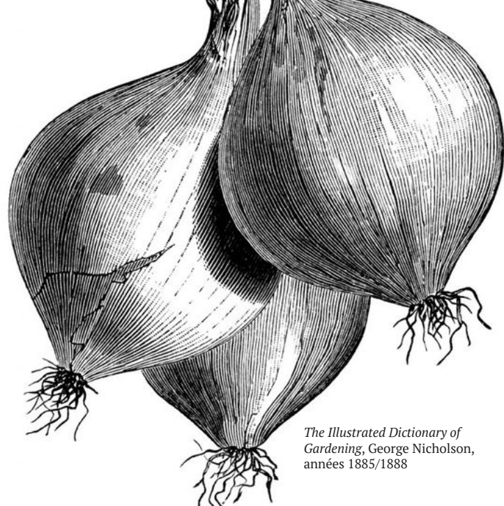
The Illustrated Dictionary of Gardening, George Nicholson, années 1885/1888

Nous souhaitons recueillir auprès de vous aussi bien la mémoire orale que des documents (photos, anciens catalogues de végétaux, archives administratives, etc.), des outils liés à des pratiques ou des techniques agricoles particulières, mais aussi, bien entendu, des végétaux et en particulier des semences (graines, greffons, tubercules, etc.).