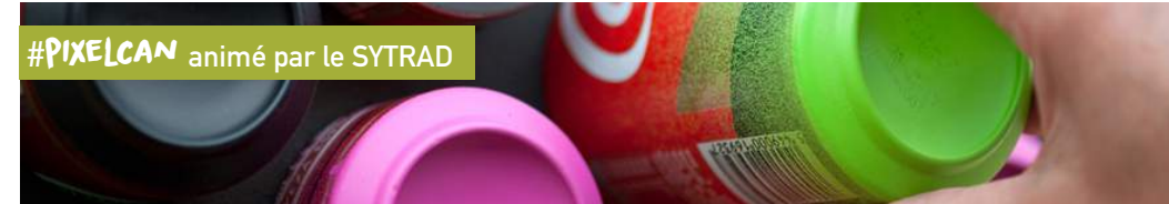
#PIXELCAN animé par le SYTRAD

" Impliqué et passionné : je suis producteur en AOP Bleu du Vercors-Sassenage " Les producteurs engagés dans la filière du Bleu du Vercors-Sassenage ont voulu, à travers leur AOP, valoriser leur système d'élevage extensif basé sur des petits troupeaux qu'ils prennent le temps de bichonner. Ce film traduit l'engagement et la passion de ces hommes et de ces femmes dont le métier garantit la qualité des produits et façonne les paysages en préservant leur environnement Jun 2019. 10 min. Loup Blanc Production.