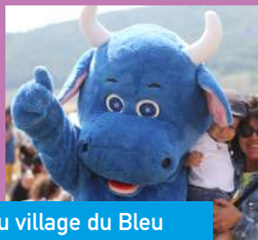
BLEUETTE , la mascotte du village du Bleu

2 BIATHLON Dans les traces des champions, découvrez cette activité avec le Vercors Ski de Fond ⌚ Sam et Dim. 10h > 18h