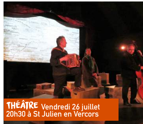
THÉÂTRE Vendredi 26 juillet 20h30 à St Julien en Vercors