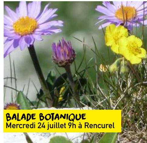
BALADE BOTANIQUE Mercredi 24 juillet 9h à Rencurel

Tout public. Gratuit. Compter 15min de marche. Pique-nique tiré du sac 📍 Ferme Bouclette et Compagnie au Bard à St Martin en Vercors