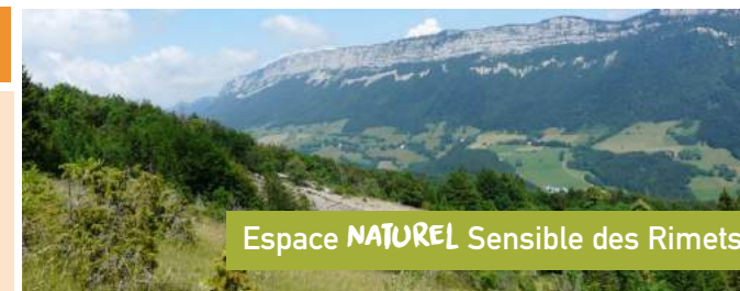
Espace NATUREL Sensible des Rimets

2 VERCOFIL elles tricotent, cousent et brodent et leurs confections seront exposées sur leur stand